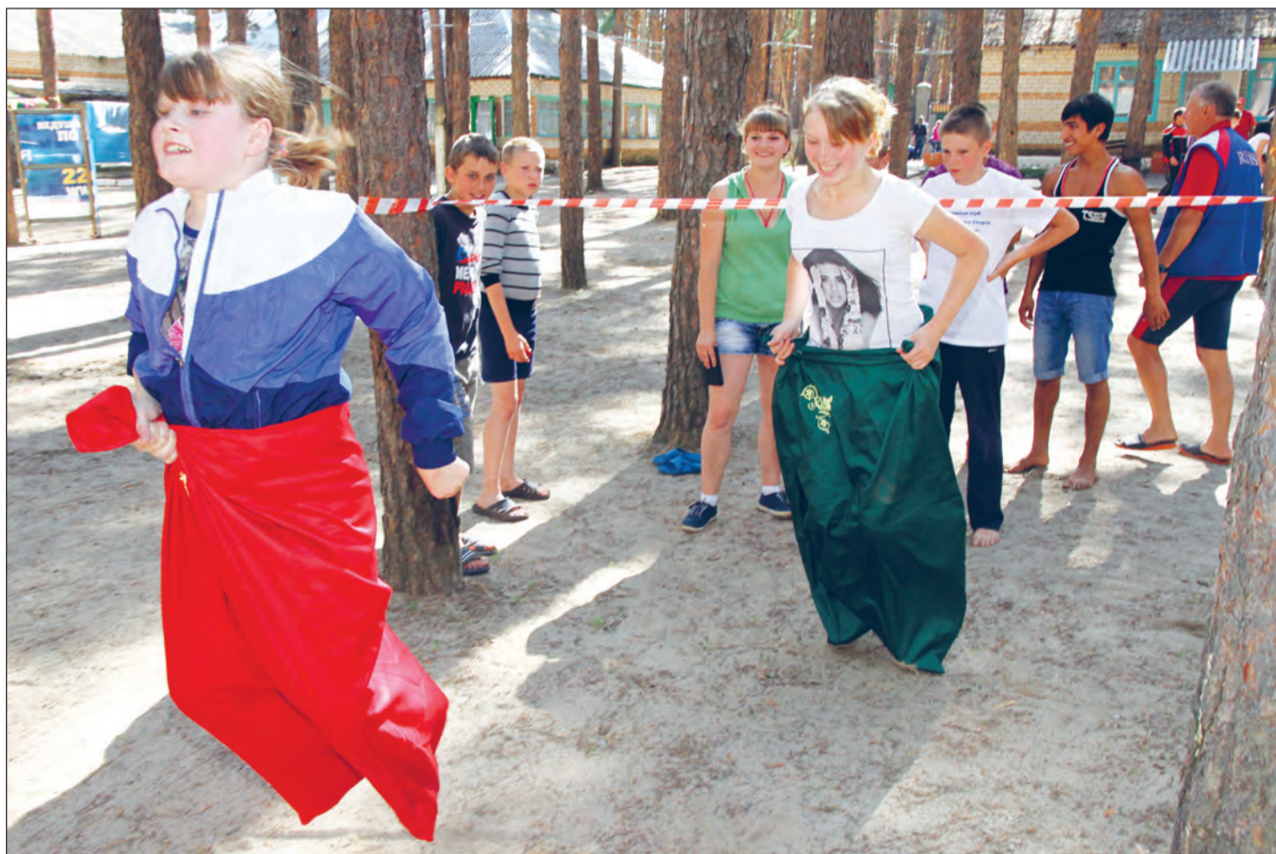
Соревнования по прыжкам в мешках многим пришлось по душе

Настоящий праздник организовал для детей из школ-интернатов Воронежской области московский благотворительный фонд «Искусство, наука и спорт»