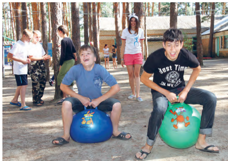
Прыжки на гигантских мячах — веселое занятие