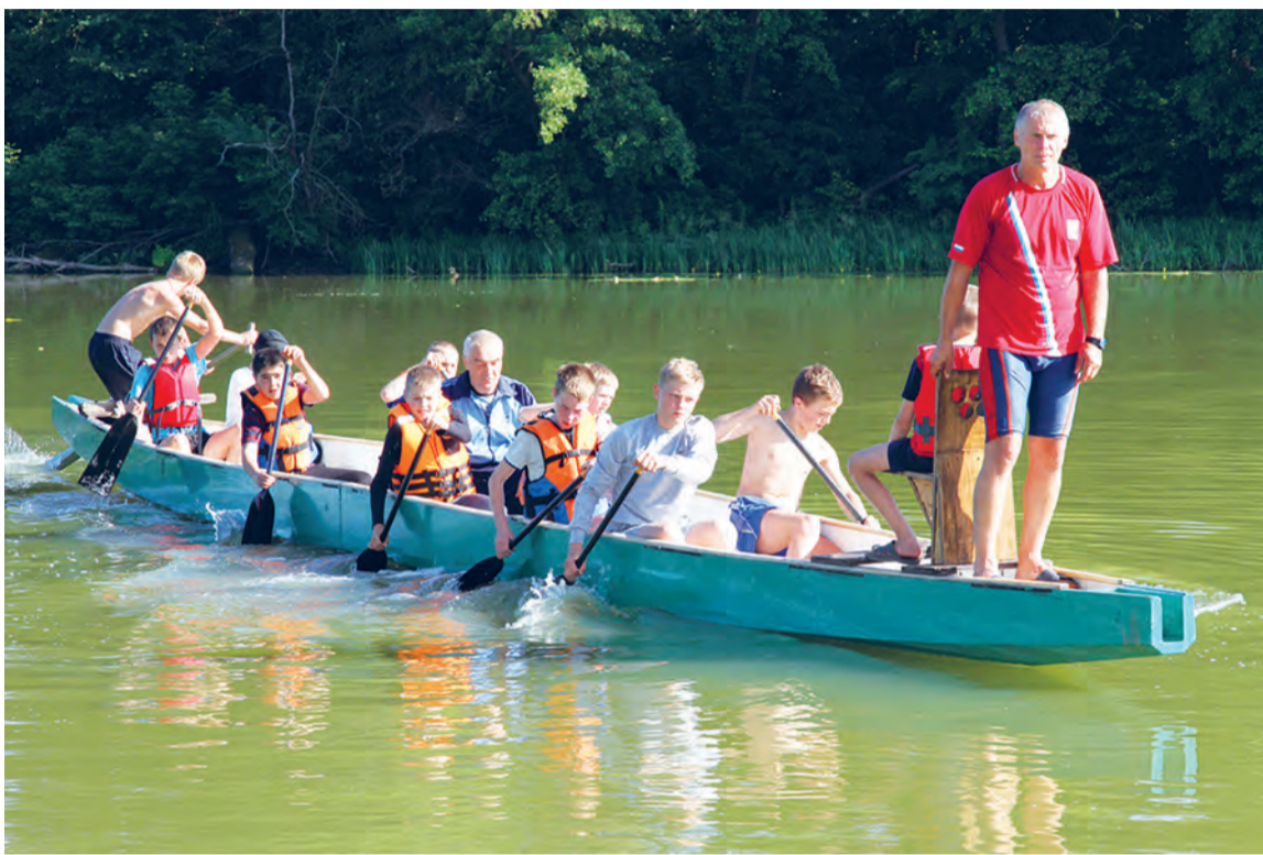
Острогосские кадеты продемонстрировали богучарцам умение сплавляться на байдарках

Разного рода развлечения для отдыхающих в «Дружке»